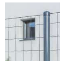
UNIVERS oszlop (lásd a kiegészítő termékeknél)