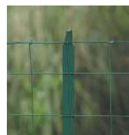
TE és Long-Life T oszlop (lásd a kiegészítő termékeknél)